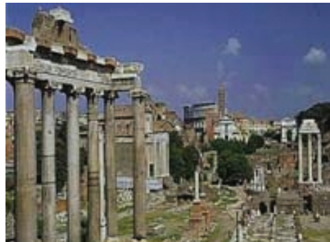
Foroaren hondakinak, Erroma

Mexikoko hiriburua da gaur egun munduko biztanle gehien dituen hiria, hogeit hamar milioi inguru. Mexikoko hiriguneak Tenochtitlán bailara zaharraren mugak gainditu ditu eta inguruko hiri asko xurgatzen ari da. Egoera hau arrunta da munduan zeharreko hirietan, zeintzuen hazkuntzan topatzen dituzten beste hirigune hauek xurgatzen dituzte azkenean. Honek askotan zail egiten du hiri bat non hasten eta bestea non bukatzen den zehaztea. Kasu honen adibide esanguratsua, Megapolis deitutakoa da, Estatu Batuetan, beste batzuen artean New York, Boston eta Filadelfia hiriak lotzen dituen mila milioi baino luzeagoa den hirigune jarrai bat da.