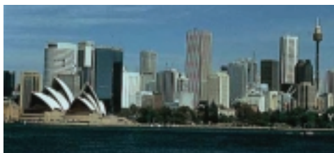
Sydney hiriko argazkia (Australia)